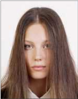
Hair covering eyes