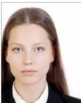
Image is not centered

■ Not meeting the requirement sizes and the standards