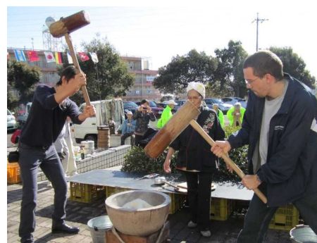
Traditional Culture Experience