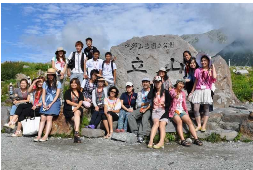
International Students Summer Trip

Monthly payment is to be made by an automatic money transfer from the bank account opened by the resident (*the bank designated by Gifu University: Kurono Branch of Juroku Bank).