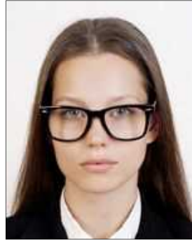
Too thick frames