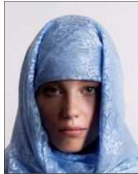
The part of the face is in shade because of head covering. (if there's no shadows and show the full face, head covering is allowed)