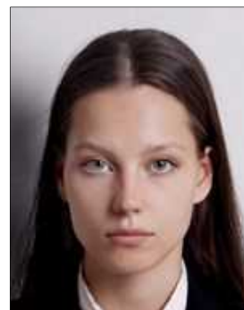
There's a shadow behind her head Not body front