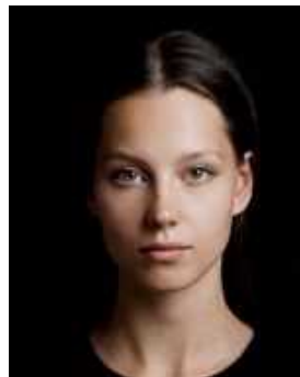
Vaguely-outlined image because of too dark behind