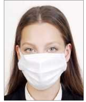
Hide one's face by a mask