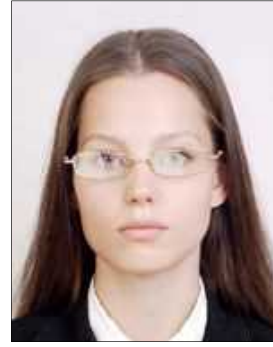
Reflection on lens