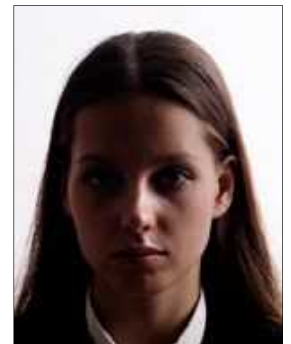
The part of the face is in shade