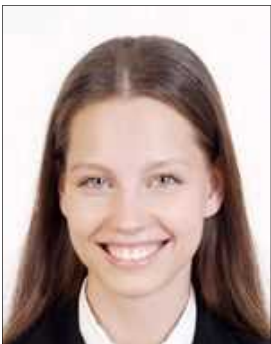
Mouth opens Looks different from normal face expression