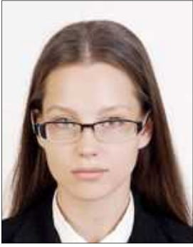
The frames across eyes